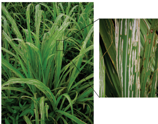
Figura 2 - Danos causados por Omalonyx d'Orbigny, 1837 às folhas do capim-elefante Pennisetum purpureum Schumacher.

Vários compostos químicos tem sido sugeridos para o controle químico de gastrópodes terrestres tais como as iscas contendo quelados de alumínio (Henderson et al. 1990); fosfato de ferro (Speiser e Kistler 2002); carbamatos e metaldeído (Henderson e Triebkorn 2002). Embora o composto metaldeído seja considerado o mais eficiente, não